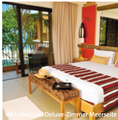
Wohnbeispiel Deluxe-Zimmer Meerseite