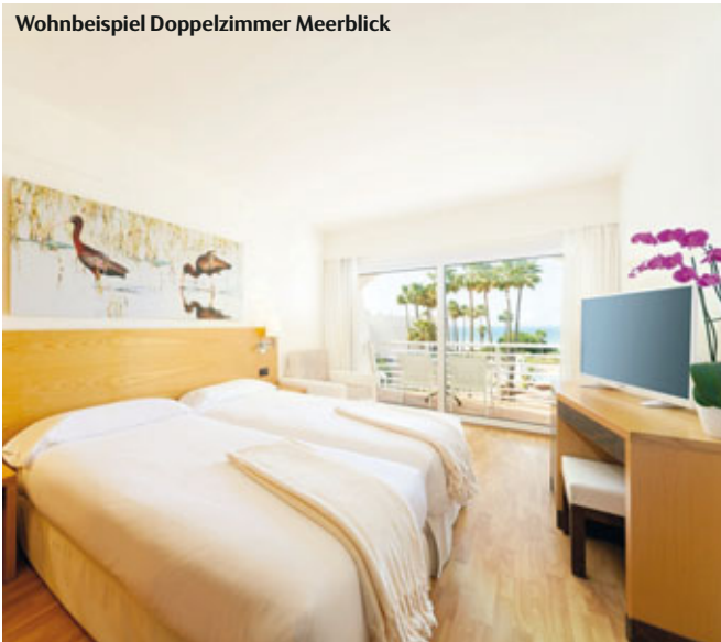
Wohnbeispiel Doppelzimmer Meerblick