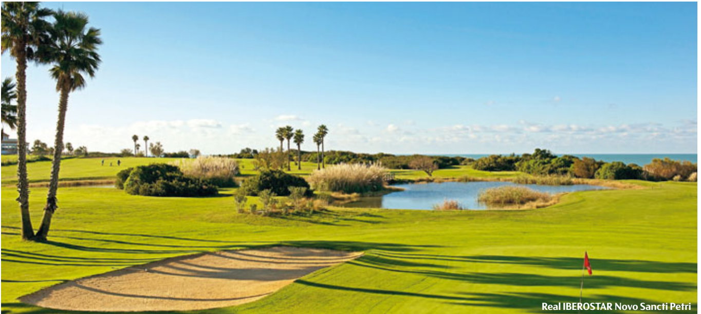
Real IBEROSTAR Novo Sancti Petri